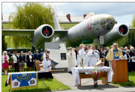
Witkowskie obchody Uchwalenia Konstytucji 3 Maja