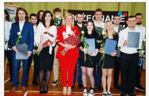
Pożegnanie Maturzystów i Święto Patrona Szkoły w ZSP w Witkowie