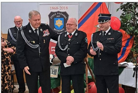
Jubileusz 155-lecia OSP Witkowo