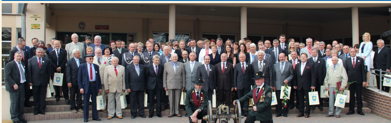
Pamiątkowe zdjęcie wykonane podczas uroczystości z okazji 25. Rocznicy Odrodzenia Samorządu Terytorialnego

Samorząd gminny jest szczególną formą prawno-ekonomiczną. Ideą jego powołania było zapewnienie mieszkańcom jako wspólnoty samorządowej działań, związanych z organizacją na danym terenie życia społeczno-ekonomicznego oraz zaspokajaniem zbiorowych potrzeb wspólnoty.