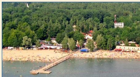
Rewitalizacja Ośrodka Wypoczynkowego w Skorzęcinie zakończona w 2010 r.