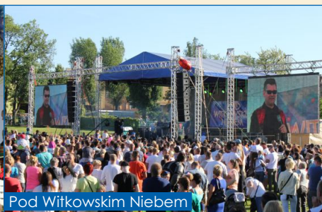
Pod Witkowskim Niebem