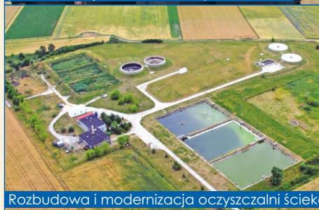
Rozbudowa i modernizacja oczyszczalni ścieków w Małachowie Wierzbiczanym