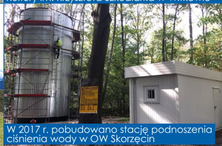
W 2017 r. pobudowano stację podnoszenia ciśnienia wody w OW Skorzęcin