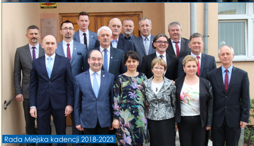
Rada Miejska kadencji 2018-2023