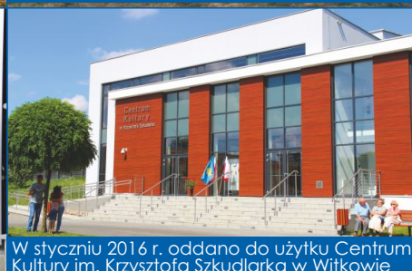
W styczniu 2016 r. oddano do użytku Centrum Kultury im. Krzysztofa Szkuclarka w Witkowie