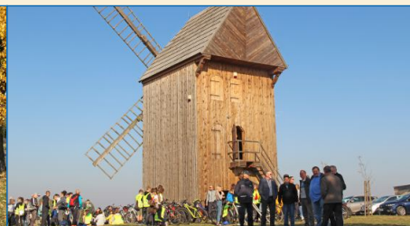
W 2014 r. odrestaurowano wiatrak typu Koźlak w Kamionce