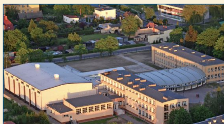
W 2012 r. oddano do użytku Halę Widowskowo-Sportową w Witkowie