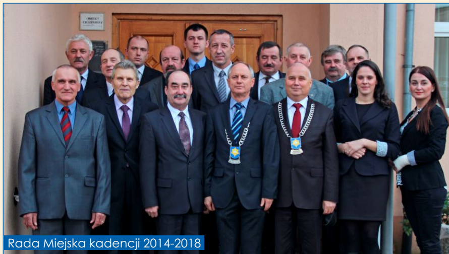
Rada Miejska kadencji 2014-2018