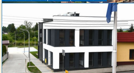
W 2019 r. rozpoczęto budowę nowej siedziby Ośrodka Pomocy Społecznej w Witkowie