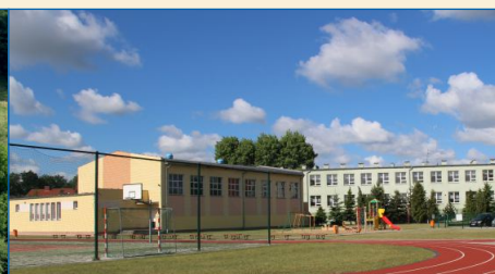
W 2012 r. otwarto kompleks sportowy w Mielżynie