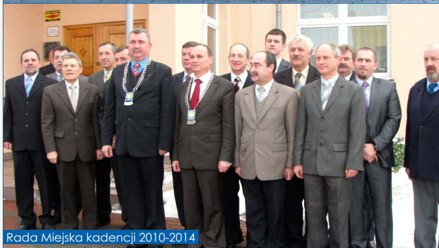
Rada Miejska kadencji 2010-2014