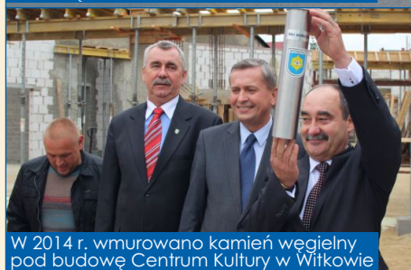
W 2014 r. wmurowano kamień węgielny pod budowę Centrum Kultury w Witkowie