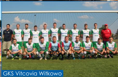
GKS Vitcovia Witkowo