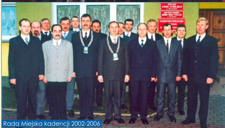
Rada Miejska kadencji 2002-2006