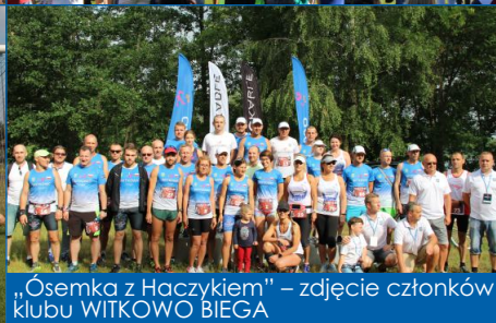
„Ósemka z Haczykiem” – zdjęcie członków klubu WITKOWO BIEGA