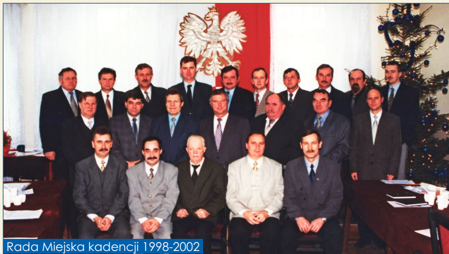
Rada Miejska kadencji 1998-2002