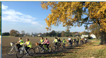
W 2018 r. odbyło się otwarcie ścieżki rowerowej prowadzącej do Skorzęcina