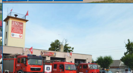
Doposażenie jednostek OSP

Społecznej, przy ul. Gnieźnieńskiej w Witkowie,