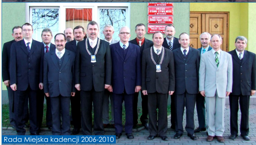
Rada Miejska kadencji 2006-2010