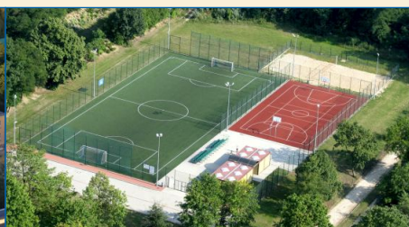
Kompleks boisk „ORLIK” w Witkowie przy ul. Wrzesińskiej pobudowany w 2009 r.